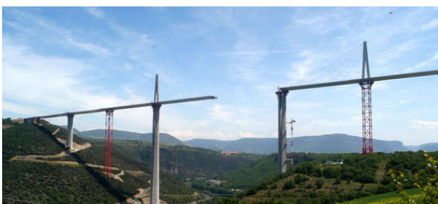
Le viaduc de Millau avant la jonction

Il est important lorsque l'on produit un document, de citer les sources de nos informations c'est à dire, citer les adresses internet des sites et le nom des livres utilisé... C'est un réflexe à acquérir.